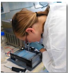
Pipettieren am Max-Planck-Institut für molekulare Genetik

Leistungsbereite und zuverlässige Schülerinnen und Schüler des Beruflichen Gymnasiums der BBS 2 AURICH können am Stipendiatenprogramm der Wissenschaftstage teilnehmen und während Praktika in wissenschaftlichen Forschungsinstituten Wissenschaftlern über die Schulter schauen und auf diese Weise Einblick in die Inhalte und den Ablauf der Arbeit in der Forschung erhalten. Zudem gibt es die Möglichkeit, an Interviews mit Zeugen der Zeitgeschichte teilzunehmen.