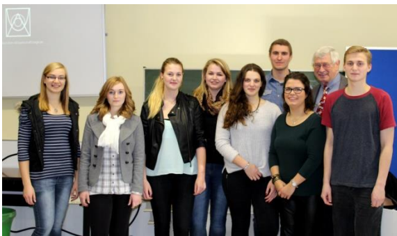
Die Stipendiaten des Jahres 2015

Die Auricher Wissenschaftstage sind eine gemeinsame Veranstaltung des Gymnasiums Ulricianum und der Berufsbildenden Schulen 2 Aurich.